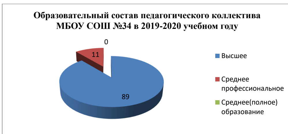
Таблица № 1.